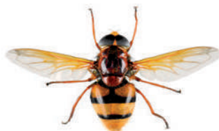
Volucelle zonée, Volucella zonaria