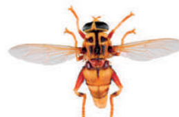
Milésie faux-frelon, Milesia crabroniformis