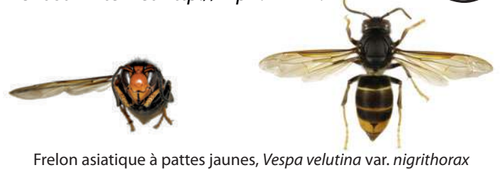
Frelon asiatique à pattes jaunes, Vespa velutina var. nigrithorax

Le frelon asiatique à pattes jaunes, Vespa velutina , est à dominante noire, avec une large bande orange sur l'abdomen et un liseré jaune sur le premier segment. Sa tête vue de face est orange, et les pattes sont jaunes aux extrémités. Il mesure entre 17 et 32mm.