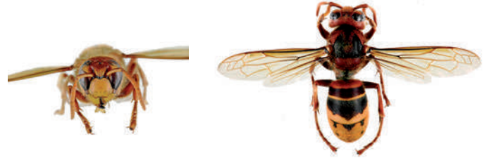
Frelon d'Europe, Vespa crabro

Le frelon d'Europe , Vespa crabro , a l'abdomen à dominante jaune clair, avec des bandes noires. Sa tête est jaune de face et rouge au dessus. Son thorax et ses pattes sont noirs et brun-rouges. Les ouvrières mesurent entre 18 et 23mm et les reines entre 25 et 35.