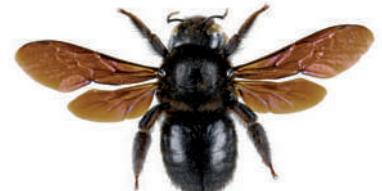
Xylocope ou abeille charpentière, Xylocopa violacea