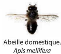
Abeille domestique, Apis mellifera