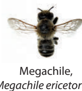
Megachile, Megachile ericetorum