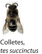
Colletes, Colletes succinctus