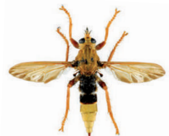
Asile frelon, Asilus crabroniformis