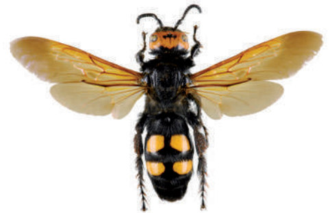
Scolie des jardins, Megascolia maculata flavifrons

La scolie des jardins fait partie des plus imposantes "guêpes" européennes. Elle est de ce fait fréquemment confondue avec le frelon asiatique. Sa pilosité est très épaisse. Son corps est noir brillant, sa tête est jaune sur le dessus et elle possède 4 zones jaunes et glabres sur l'abdomen. C'est un parasite de larves de gros Coléoptères (comme le Hanneton).