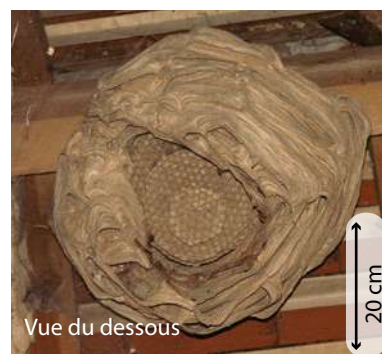
Vue du dessous

arbres creux, cheminées rarement aérien cylindrique ouverture large vers le bas ~ 30x60 cm