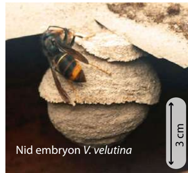
Nid embryon V. velutina

Au printemps, chaque reine fondatrice construit seule son nid dans un lieu souvent protégé. Chez la plupart des guêpes le nid embryon ressemble à une petite sphère de 5 à 10 cm de diamètre avec une ouverture vers le bas. Chez les frelons, la colonie n'hésitera pas à déménager si l'emplacement ne convient plus (manque de place, de sécurité).